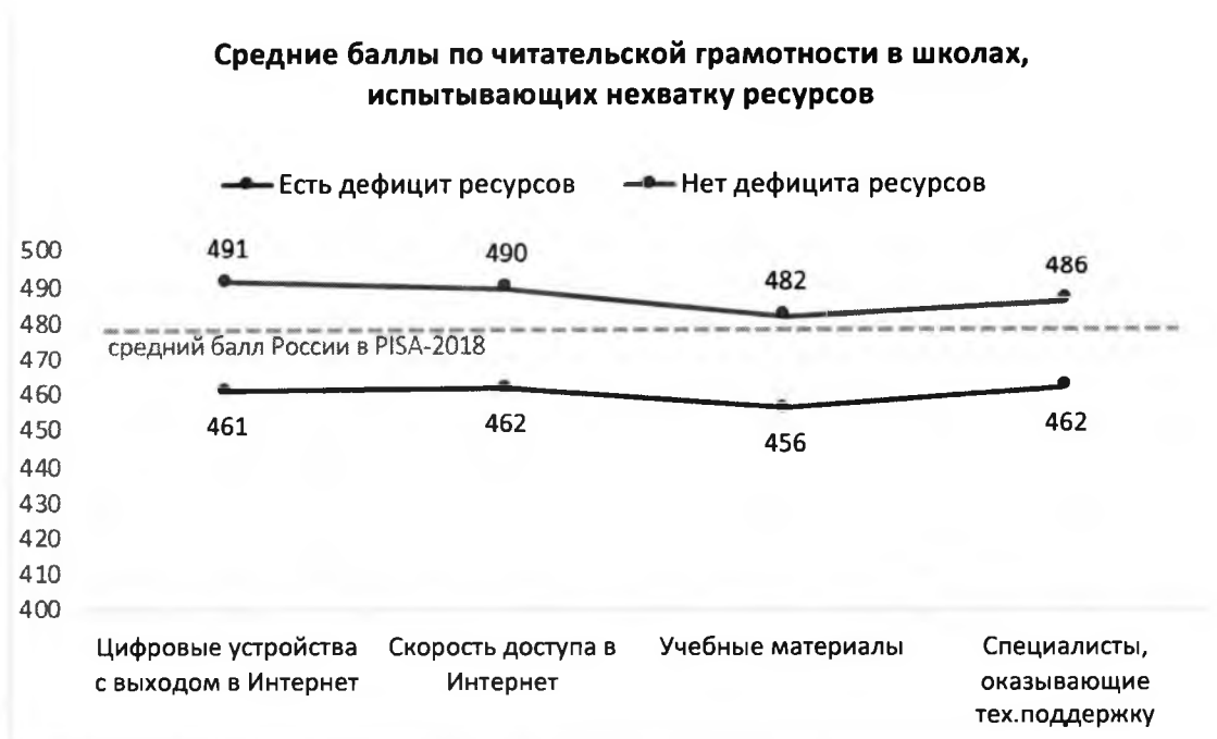
Рисунок 2. Дефициты ресурсов образовательной организации и результаты обучающихся по шкале читательской грамотности PISA относительно среднего результата РФ в PISA-2018

Дефициты ресурсов определялись на основании ответов администрации школ на вопросы анкеты и могут отражать субъективную точку зрения директора.