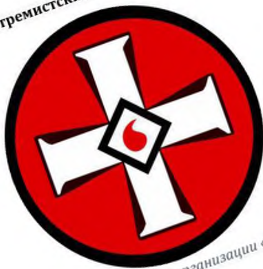
Рисунок 1. Эмблема ультраправой организации «Ку-клукс-клан»