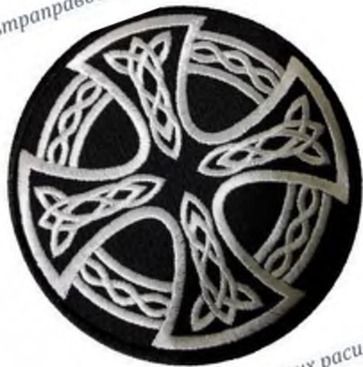
Рисунок 2. Кельтский крест. Символ многих расистских с