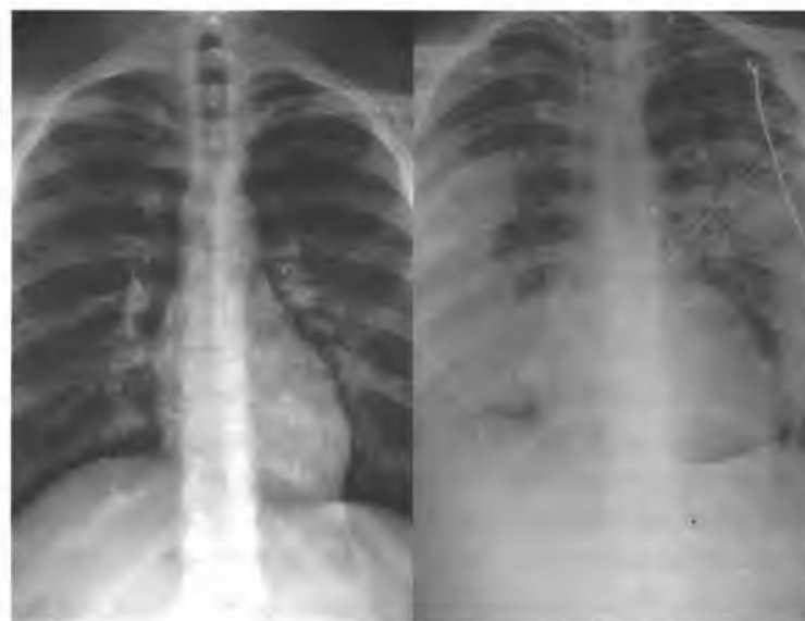
Рис.6. Здоровые легкие (слева) и легкие после 5 дней использования вейп-устройства

как: «Повреждение легких, связанное с употреблением электронных сигарет или продуктов вейпинга». Данное заболевание будет внесено в МКБ-11, а пока CDC рекомендует кодировать эту болезнь другими подобными заболеваниями. EVALI может отражать спектр болезненных процессов, а не один конкретный процесс. Отдельные сообщения о заболеваниях легких, связанных с вейпингом, описывают острую эозинофильную пневмонию, диффузное альвеолярное кровоизлияние, липоидную пневмонию, и респираторный бронхиолит, ассоциированный с интерстициальным заболеванием легких (рис.6).