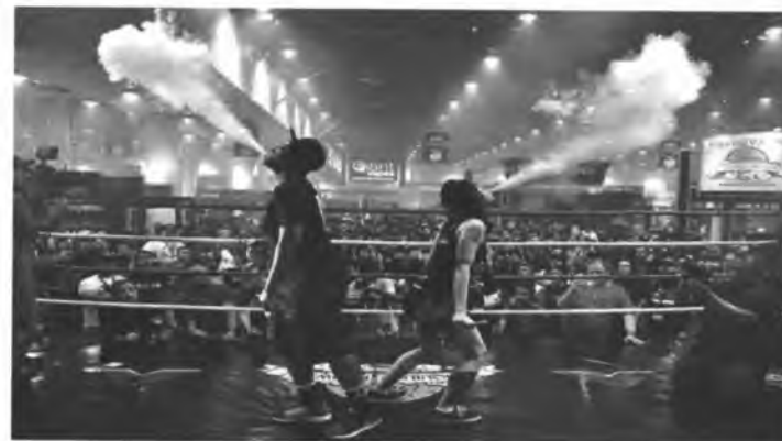
Рис. 2. Вейпинг соревнование

Быстрому распространению курения ЭС (вейпингу) способствуют компании-производители, которые превратили курение ЭС в целую субкультуру. В мире на регулярной основе проводятся субсидируемые компаниями-производителями выставки и соревнования среди курильщиков ЭС (рис.2). Это так называемые: «Cloudchasing» (мастерство выдувания облаков пара), «Tricks» (трюки с паром) и «Вейпинг-алхимия» (соревнования по составлению новых жидкостей для вейпа).