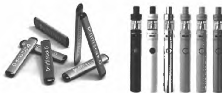
Рис. 5. Одноразовые (слева) и многообразные (справа) электронные сигареты

Одноразовые ЭС рассчитаны на 200 - 500 затяжек пара. В многообразных устройствах нет таких ограничений и они работают до тех пор, пока доливается жидкость в емкость.