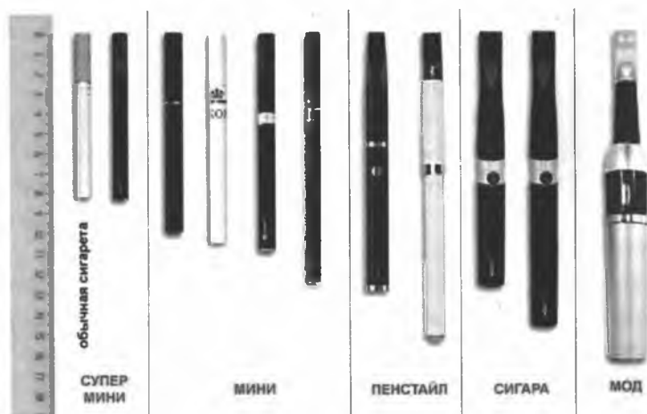
Рис.4. Типы и размеры электронных сигарет

Электронные сигареты (вейпы) классифицируются также по типу и размеру (рис.4) в соответствии с длиной (от 82 мм до 175 мм).