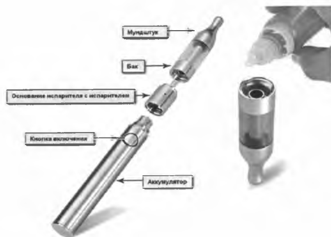
Рис. 3. Устройство электронной сигареты

Обычная электронная сигарета состоит из аккумулятора, электрического испарителя, емкости для жидкости, мундштука и дополнительных элементов для автоматического управления подачей аромажидкости (но последние имеются не во всех моделях), рис.3.